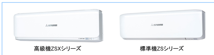
図1 イタリアンデザインを採用した室内機

イタリアのデザイン会社 TENSA 社(本社ロンバルディア州ミラノ県)との共同デザインにより、ヨーロッパの洗練されたデザインを採用した。デザイン性を追求するために、室内機内部の部品配置を最適化し、ベールに包みこまれているようなフォルムでインテリアと調和し、インテリアの一部となるような薄型でスタイリッシュなデザインの室内機を開発した。また、標準機クラスの ZS シリーズもデザインコンセプトを統一し発売中である(図1)。