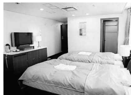
図4 特別室 (DECK 5) の様子 快適で豪華客船並みの居住設備を 有している。

行なった。1つは航海速力を既存船の航海速力20ノットから23.5ノットと大幅にアップさせ、航海時間を約1時間短縮した。もう一つは荷役の高速化により港の停泊時間を短縮した。