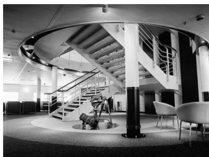
図3 エントランス (DECK 3) 本船の顔とも言えるエントランス では結婚式も行うことができる。