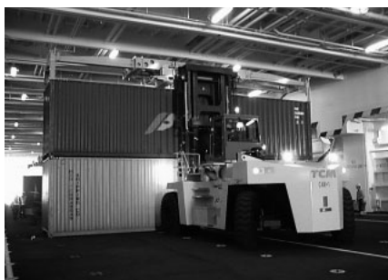
図2 トップリフターによる荷役 本船は従来フェリーにはない40ft コンテナの倉内2段積みが可能。