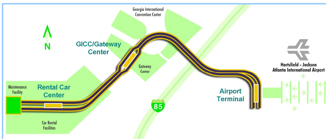
図1 アトランタ APM システム路線図