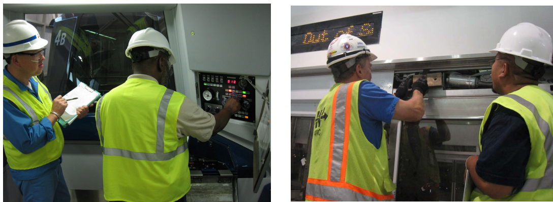
図3 トレーニング風景

システムの運行及び保守は“クリスタル・ムーバー・サービス(Crystal Mover Services, Inc.)”(以下 CMS)が担当する。CMS は当社が受注した米国 APM システムの運行と保守(Operation & Maintenance) (以下 O&M)を行うために米国三菱重工, 米国住友商事と住友商事の出資で米国に設立された O&M 事業会社である。当社アジア案件での O&M 業務の実績とノウハウを生かしたトレーニングプログラムを立案, 作業員へのトレーニングを実施するとともに(図3), 試運転期間中からシステムの運用や車両運転などの実務を当社作業員とともに行うことでスキルアップを図った。また, 営業運転開始後も当社技術者による定期的な反復トレーニングを展開することで, 開業直後から安定した運行を実現している。安定運行の指標となる“稼働率(運行計画通りにシステム全体が運用されると稼働率 100%となる)”は開業当初から連続で 99.8%以上を保持しており, 利用者に安定したサービスを提供することで当社 APM システムの信頼性・安全性を示すとともに, アトランタ航空局からの信頼獲得に大きく貢献している。