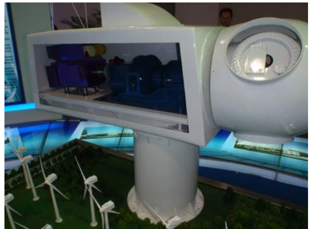
中国風車メーカー（北車风电：CNR）