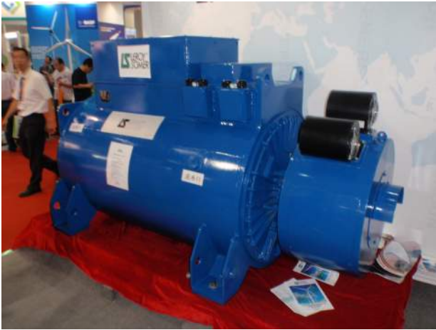
発電機 (2 MW 用)

の多様なコンポーネントメーカーが育っています。但しその品質や信頼性は、まだ見極めが必要だと思われます。