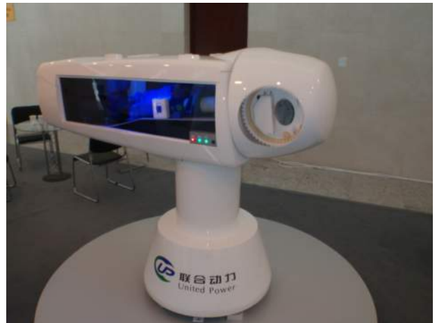
中国風車メーカー（総合電力：United Power）