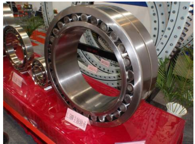
大型軸受 (1.5MW 用)