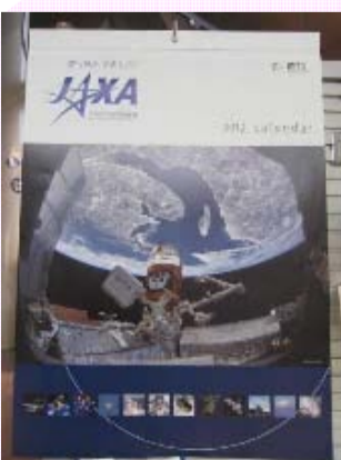
2012 JAXA カレンダー ¥1,680

ミュージアムショップより、この冬にオススメの商品をご紹介します! クリスマスプレゼントやご家族やお友達へのお土産にもどうぞ。