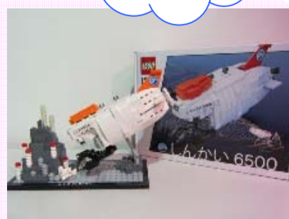
しんかい6500 レゴ ¥4,830