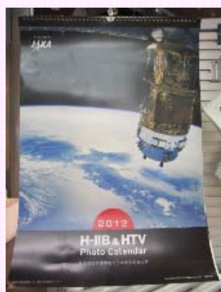
H-II B&HTV カレンダー ¥1,890