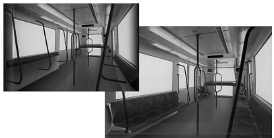
図3 インテリアデザインのバリエーションの一例