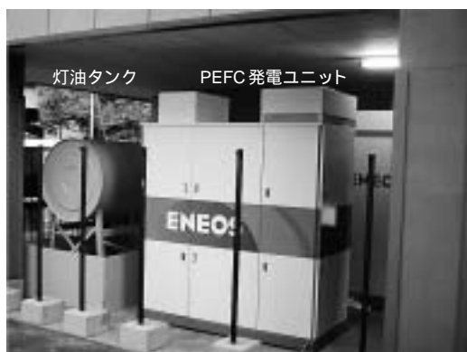
図2 10 kW級業務用PEFCシステム外観 安価な灯油を用いたPEFCシステム。

民生業務用途においてPEFCシステムの普及が期待されている。当社は、新日本石油(株)と共同で、灯油燃料の10 kW級PEFCシステムを開発し(財)新エネルギー財団“定置用燃料電池実証研究(国庫補助事業)”の一環として、今年から東京都内のコンビニエンスストアに設置し実証試験を開始した。システム外観を図2に示す。